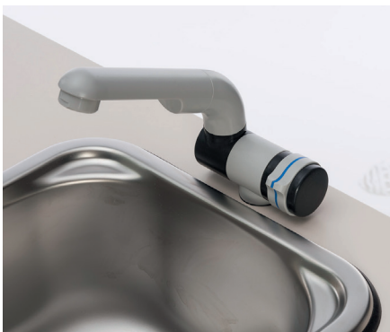
Lavello in acciaio inox con rubinetto a circuito chiuso