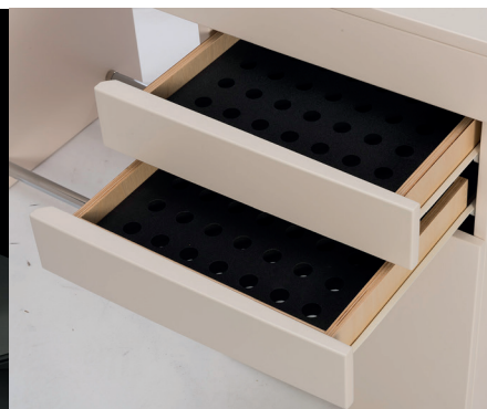
Cassetti con vano porta lenti a contatto