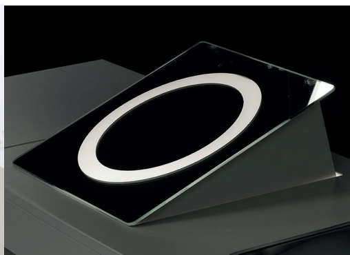
Specchio con retroilluminazione regolabile in altezza